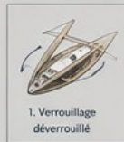
1. Verrouillage déverrouillé

Système simple, robuste et peu énergivore.