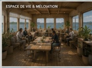
ESPACE DE VIE & MÉDIATION