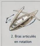
2. Bras articulés en rotation