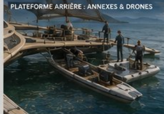
PLATEFORME ARRIÈRE : ANNEXES & DRONES