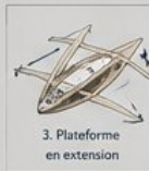
3. Plateforme en extension