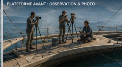
PLATEFORME AVANT : OBSERVATION & PHOTO