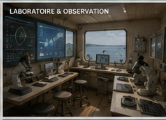
LABORATOIRE & OBSERVATION