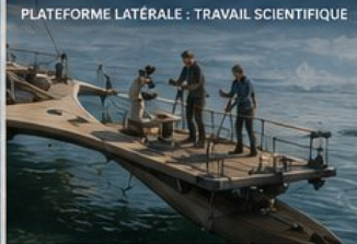
PLATEFORME LATÉRALE : TRAVAIL SCIENTIFIQUE