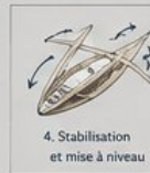
4. Stabilisation et mise à niveau