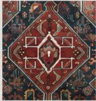
Motif du tapis traditionnel