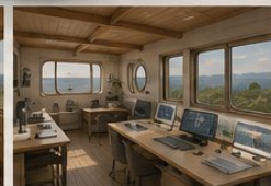
LABORATOIRE & OBSERVATION Recherche, documentation, analyse.