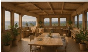
ESPACE DE VIE & MÉDIATION Convivialité, partage et ancrage humain.