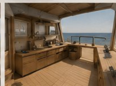
PLATEFORMES DÉPLOYABLES Observation, prélèvements, ateliers.