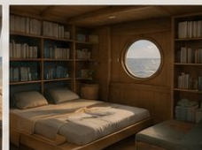
ESPACE INTIME Repos, concentration, écriture.